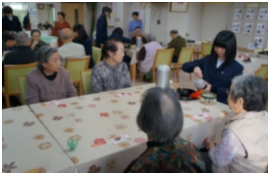
北信越大会・全国大会に出場